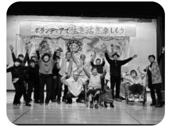
【ボランティア交流会】