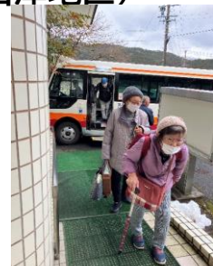
上石津町内各所からコミュニティバスに乗って集まります!

午後はオセロゲームに興じ、折り紙を折り、脳トレプリントに頭をひねります。ボーリング、輪投げ、風船バレーに競争心を煽られ、手品や踊りの鑑賞なども盛り上がります。午後 3 時を過ぎると、再びバスに乗って帰路に着きます。