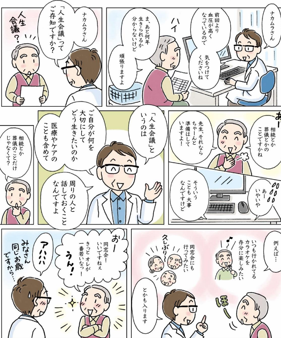
イラスト/漫画：榎谷智子