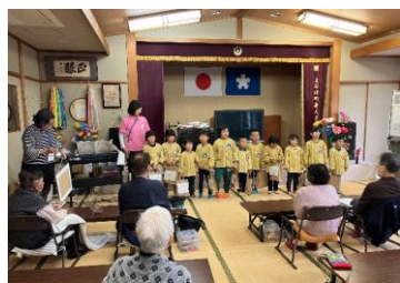
行事があるとみんなで楽しめます。保育園児との交流会でほっこり

*お元気さんの声①「朝、バス停まで歩いてバスに乗って毎日通っているよ。毎日来てお風呂とマッサージ、週 1 回の買い物が楽しみだね。」